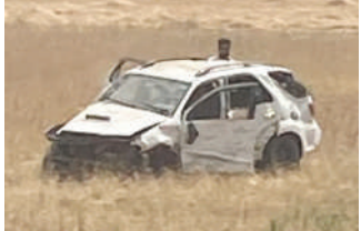
● खेतों में जा घुसी फार्चूनर कार की हालत ऐसी हो गई।

गया। हादसे के फौरन बाद मौके पर आए एक ग्रामीण ने घटनास्थल का वीडियो बनाकर वायरल कर दिया। जिसमें उसने बताया कि थोड़े वक्त पहले ही यह हादसा मलकपुर बेट गांव के सामने हाड़वे पर हुआ है।