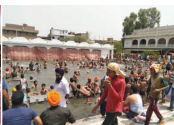
● ऐतिहासिक गुरुद्वारा गऊघाट के सरोवर में स्नान करती संगत