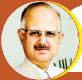
PIYUSH KANT JAIN

Former: Additional Advocate General, Punjab