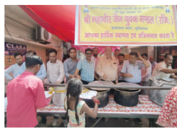
● भगवान महावीर जयंती पर श्री एसएस जैन समा हैबोवाल एवं श्री महावीर जैन युवक मंडल हैबोवाल की तरफ से लंगर लगाया गया।