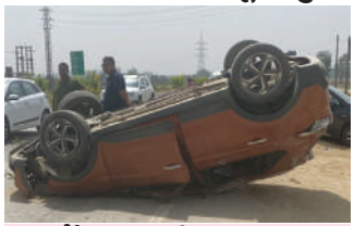
● हाड़वे पर पलटी खाकर क्षतिग्रस्त क्रेटा गाड़ी

लुधियाना/यूटर्न/14 अप्रैल। वीरवार की सुबह जीटी रोड पर लाडोवाल बाड़पास स्थित मलकपुर बेट गांव के नजदीक बड़ा सड़क हादसा हो गया। तेज रफ्तार से जा रही दो कारें आपस में टकराने लगीं तो बचने के चक्कर में एक बेकाबू कार तो हाड़वे पर ही पलट गई। जबकि दूसरी गाड़ी तो हाड़वे से उतरकर काफी दूर तक खेतों में चलने के बाद क्षतिग्रस्त होकर रुक गई। गाड़ियों की हालत देखकर साफ अंदाजा लग रहा था कि दोनों गाड़िया ओवरस्पीड थीं। सड़क पर एक पलटी खाने के बाद क्रेटा गाड़ी के पहिए ऊपर हो जाने की वजह से वह थोड़ी घिसटकर रुक गई। जबकि खेतों में जा घुसी फार्चूनर का एक दरवाजा टूट गया और वह बहुत दूर जाकर कटी फसल के कारण घिसटती हुई रुकी। यह तो शुक्र रहा कि दोनों ही गाड़ियों के बैलून खुल जाने से उसमें बैठे नाबालिग बच्चों का बचाव हो